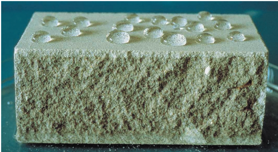
Фото 1. Жемчужный эффект на гидрофобизированной поверхности.

подавляющее большинство качественных гидрофобизаторов состоит из смеси силан/силоксанов с добавлением различных вспомогательных веществ. Помимо растворителя, к вспомогательным веществам также относятся эмульгаторы, консерванты и катализаторы. Реже