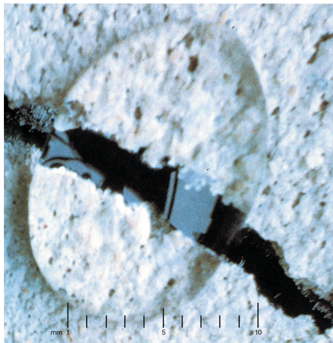
Фото 4. На фото видно, что в результате гидрофобизирующей обработки влага не может проникнуть в поверхностную зону даже при наличии микротрещин.