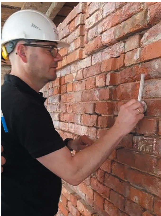
Фото 3. Применение трубки Карстена на объекте.

поэтому интервалы между проходами должны быть короткими. Для повышения скорости обработки большой участок лучше разбить на небольшие захватки, которые пропитываются по отдельности.