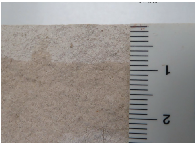
Фото 2. Глубина проникновения гидрофобизатора.

Сложнее с качеством самого действующего вещества и его концентрацией. Последние сильно влияют на стоимость состава. Экономия на действующем веществе или на его количестве, в конечном счете, отражается на качестве выполненных работ и конечном результате. Здесь работает принцип: применение качественного действующего вещества в низкой концентрации так же плохо, как и применение низкокачественного вещества в достаточной или высокой концентрации.